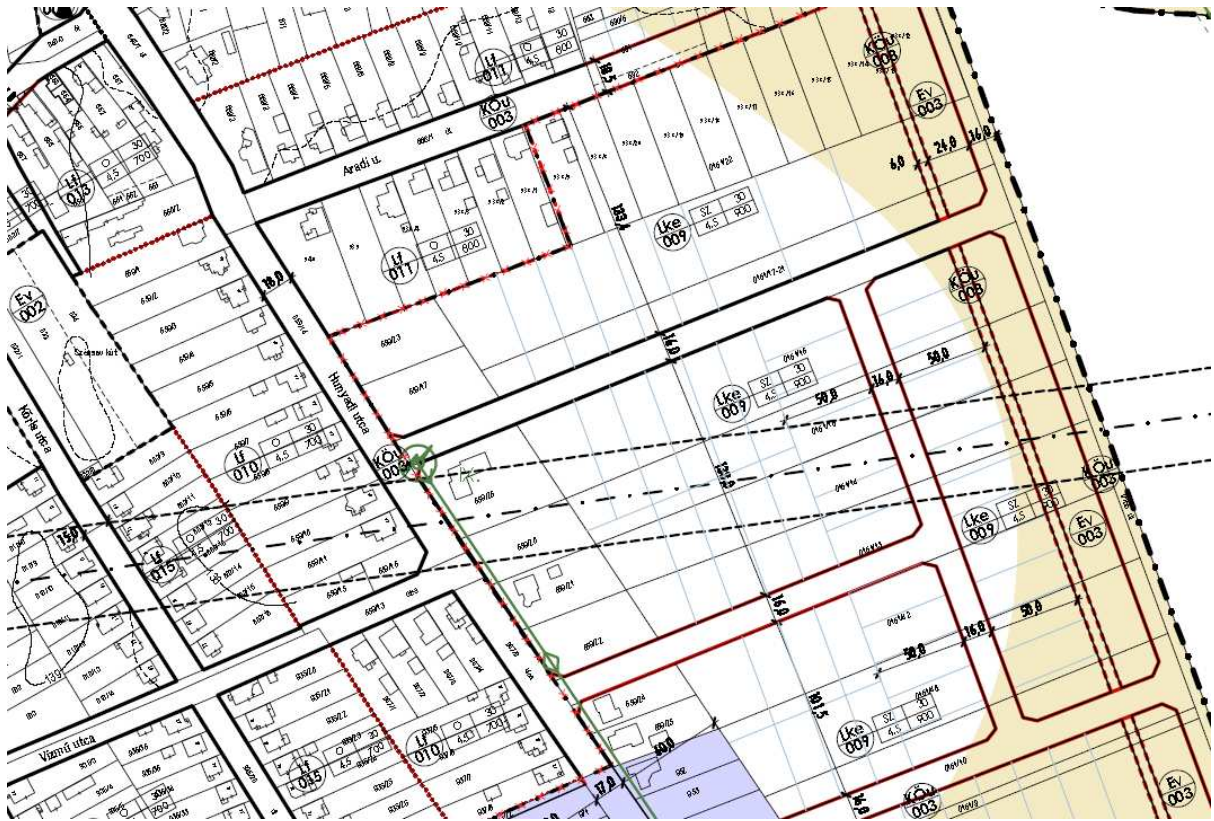
Kivonat Répcelak város Szabályozási tervéből

A Hunyadi utca végszakaszán az önkormányzat tulajdonában jelenleg 5 db 968 és 1176 m 2 -es építési telek áll az építkezni vágyók rendelkezésére, de a tervezett M86-os út, illetve a 400 kW-os magasfeszültségű távvezeték közelsége miatt nem kívánnak odaköltözni a fiatalok. Indokként a leendő zajterhelést, a forgalomból származó légszennyezést és az elektroszmogot hozzák fel. Előfordult már, hogy a Répcelakon letelepülni szándékozó fiatal pár, telek hiányában a környező települések egyikén vásárolt ingatlant magának.