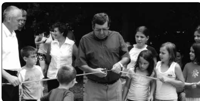
A Linde játszótér avatása