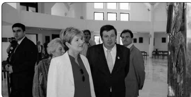
Szili Katalin – az országgyűlés elnöke – látogatása