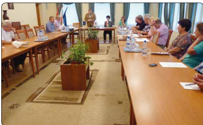
Képviselő-testületi ülés 2014.08.28.