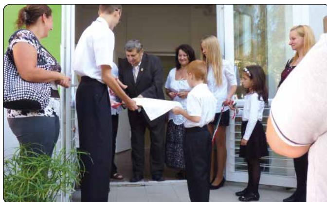
A felújított iskolakonyha-átadó 2014.08.29.