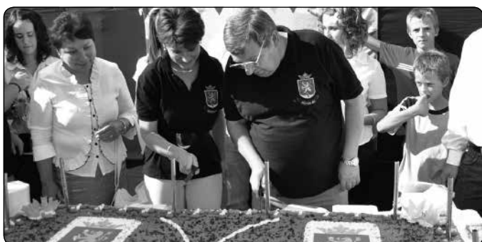
Tíz éves város Répcelak - Az ünnepi torta felszélése