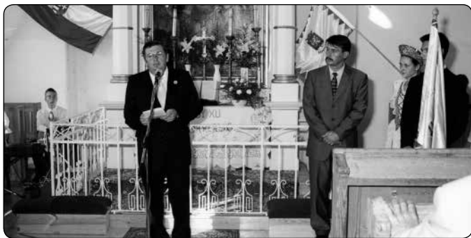
Millenniumi zászló átadása Áder Jánossal, az országgyűlés elnökével 2000