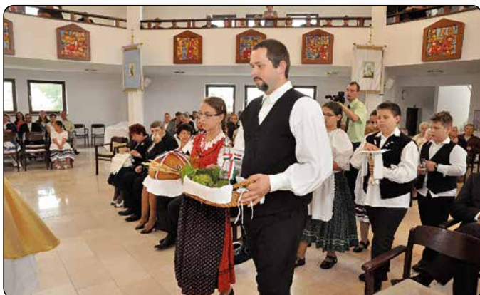
Augusztus 20-i ünnepség 2014.08.20.