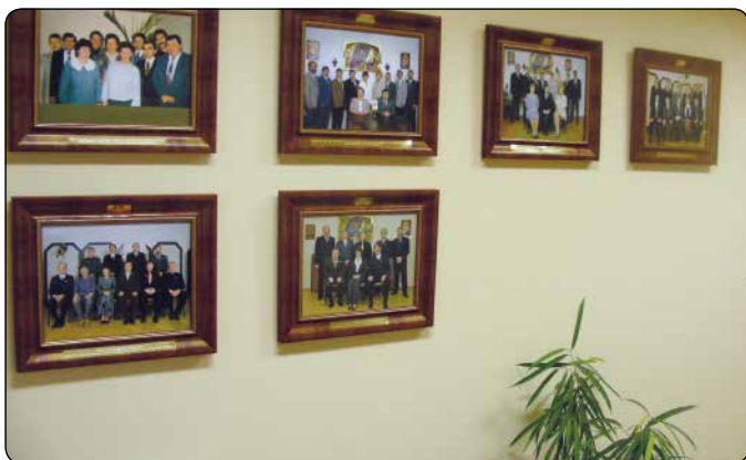
A hivatal folyosóján 2014.09.12.