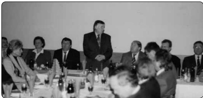
Testvértelepülési szerződés ünnepélyes aláírása