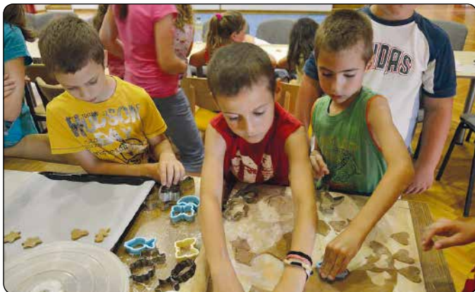
Kézműves tábor 2014.07.07–18.