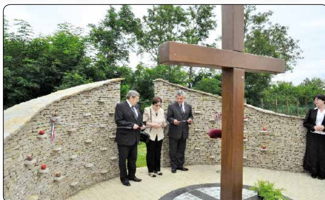
Kegyeleti park átadása 2014.08.20.