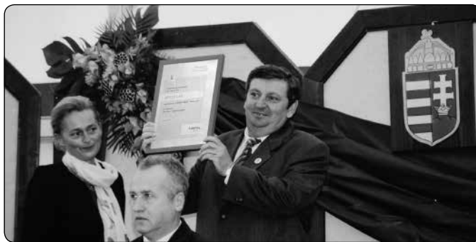
Répcelak város – oklevéltárvétel Dr. Dávid Ibolya igazságügyi miniszertől 2001