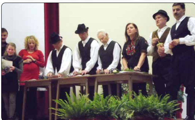
2014. 10. 25. – 20 éves az Ümmögő