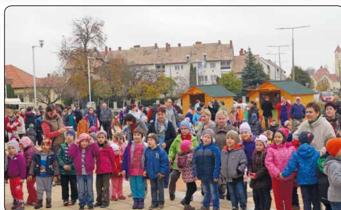
2014. 11. 07. – Márton nap a fűtőren