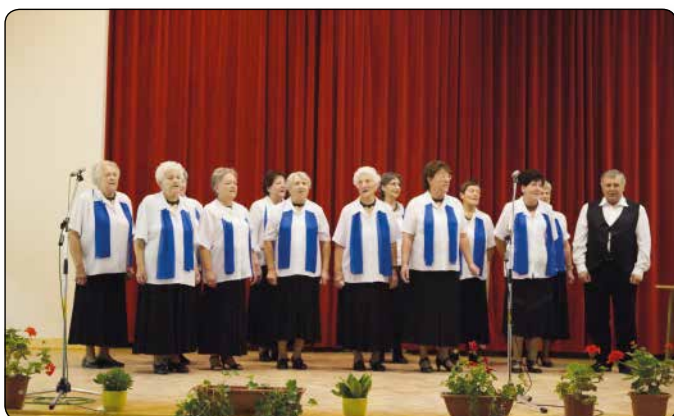
2014. 11. 08. – Kistérségi énekkari találkozó