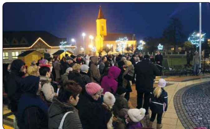
2014. 11. 30. – Adventi gyertyagyújtás