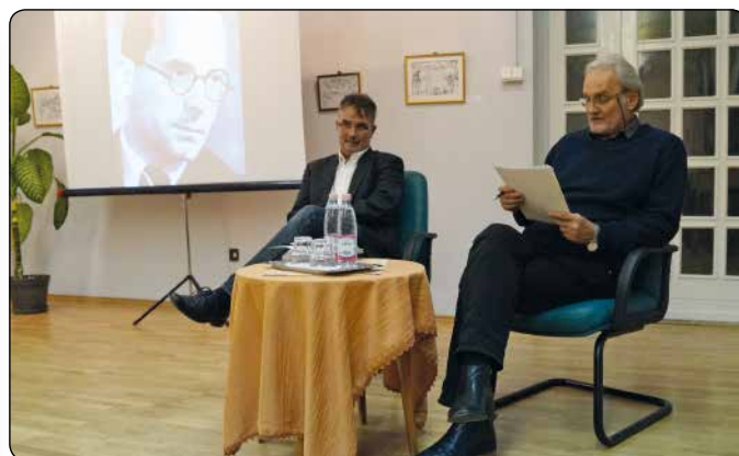
2014. 11. 19. – A harmadik torony – Irodalmunk gyöngyszemei