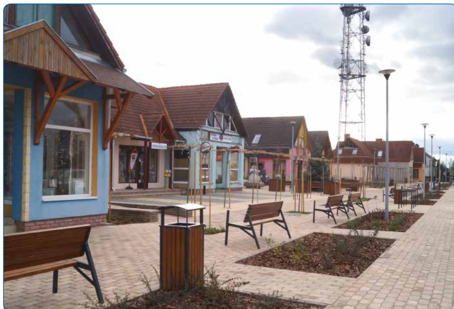
A megújult tér

retném megköszönni az üzlettulajdo- nok megértő hozzáállását az építkezés ideje alatt, és a homlokzatok felújítá- sában való együttműködésüket. Az üzletsoron a festési munkálatok jövő