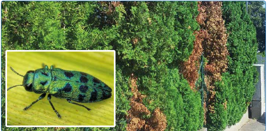
Boróka tarka-díszbogár és kártétele. Kezdetben csak apró foltok jelzik a jelenlétét, később az egész növény elhal.

A boróka tarka-díszbogárnak a lárvája rág a kéreg alatt, míg a boróka-, illetve tujaszú lárvája és a kifejlett bogár is. A védekezés azért nehéz ellenük, mert a növény belsejében rág, ezért permetszerrel lehetetlen elérni őket. Ugyanakkor nincsen meghatározott rajzási idejük, amikor a szabadban tartózkodnak, és áttelepülnek a szomszéd növényekre, ez májustól októberig bármikor megtörténhet. Megfigyelésük ragacsos sárgalappal lehetséges (bár nem túl szép látvány a növényen). A szűbogár 2–2,5 mm-es, barnásfekete színű. A boróka-tarkadíszbogár 6–12 mm hosszú, fémfényű, aranyzöld-kékeszöld színű, hátán 10–14 db kékesfekete folttal. Ha a rovarok valamelyikét azonosítjuk a sárgalapon, akkor permetezzünk pl. Decis (4 ml/10 l víz), Lamdex Extra (korábban Karate) (10 g/10 l víz) vagy Cyperkill (4 ml/10 l víz) készítménnyel, lehetőleg