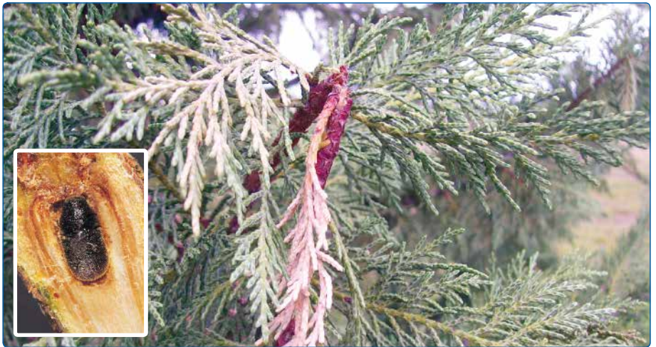
Borókaszú és kártétele Leyland cipruson. Jellegetes a lógó ág.

az esti órákban. Fontos, hogy a növény belsejébe is jusson a permetszerből.