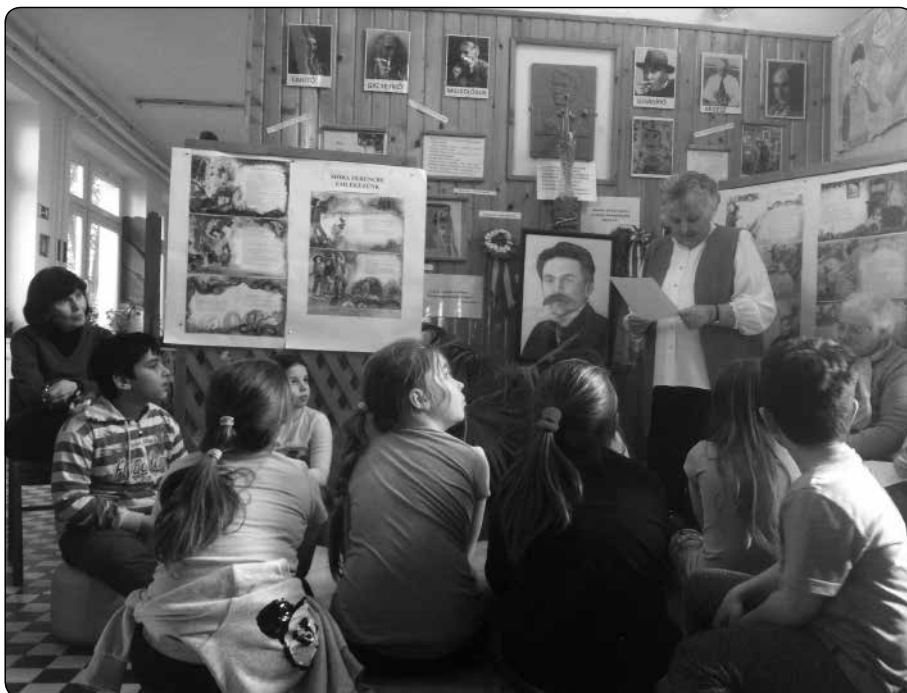
Verskedvelőkkel a Móra-falnál

Rendbontás, súlyos magaviseleti problémák esetén a gyermekkel, a szülőkkel mindig személyesen találkozunk az iskola vezetője, átbeszéljük a történeteket, hogy közösen megoldásra jussunk, és adott esetben szakemberek segítségét kérjük. A szülői észrevételre nyitottak vagyunk, hogy közösen for-