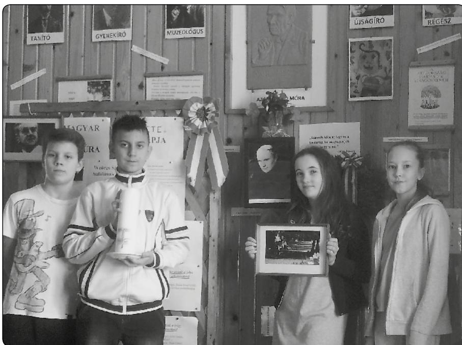
Feltárul az értéktár megyei versenyzői

máljuk, közösen segítsük a gyerekek személyiségének alakulását. Az iskolában helyet adtunk egy előadássorozatnak is, összefogásban a helyi civil szervezettel és megyei szakmai szervezettel a tanulás megkönnyítésére, a viselkedési és tanulási problémákkal küzdők érdekében. Az utolsó előadás címe: „Fejlesztési lehetőségek otthon és szervezeti keretek között”. Logopédussal, szakszolgálati vezetővel és gyógypedagógussal találkozhattak a szülők az előadások keretében.