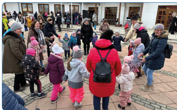
02. 10. – Óvodás télüző felvonulás.