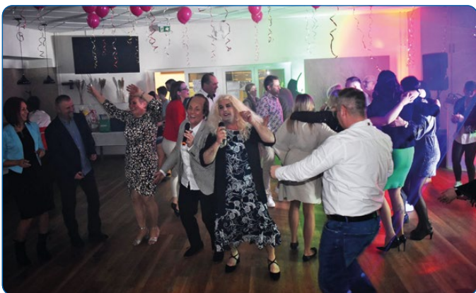
02. 18. – Óvodás bál.