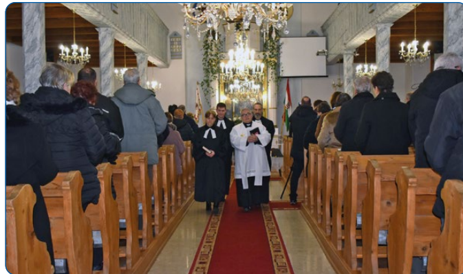
01. 22. – Ökumenikus imabét – záró istentisztelet.