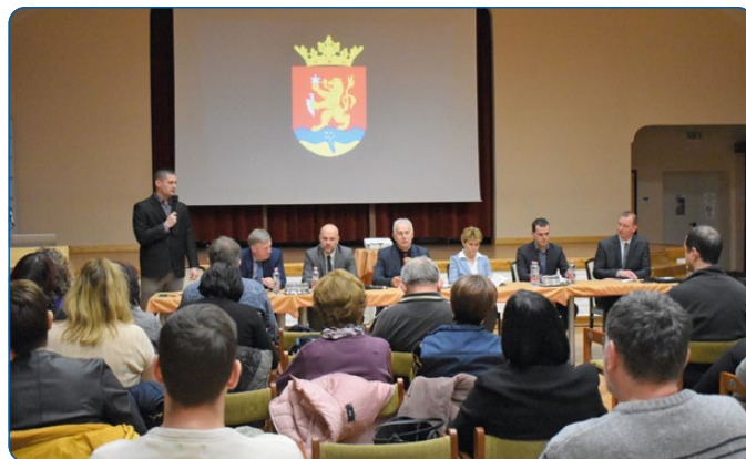
02. 15. – Közmeghallgatás.