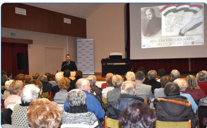
01. 27. – Magyar Kultúra Napja ünnepség.