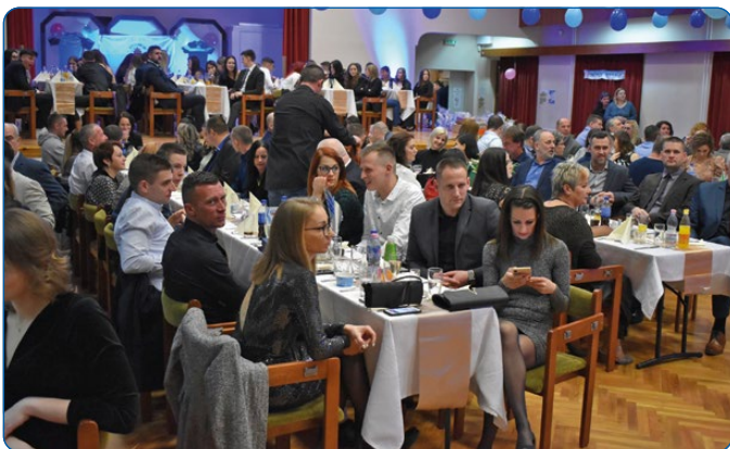
02. 11. – Sportbál.