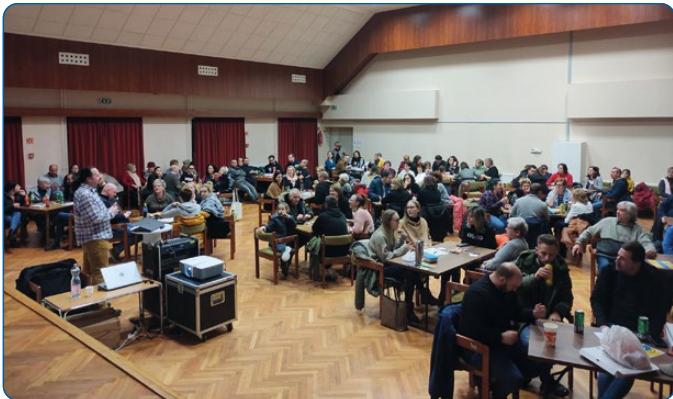
01. 11. – Kvízajnokság.