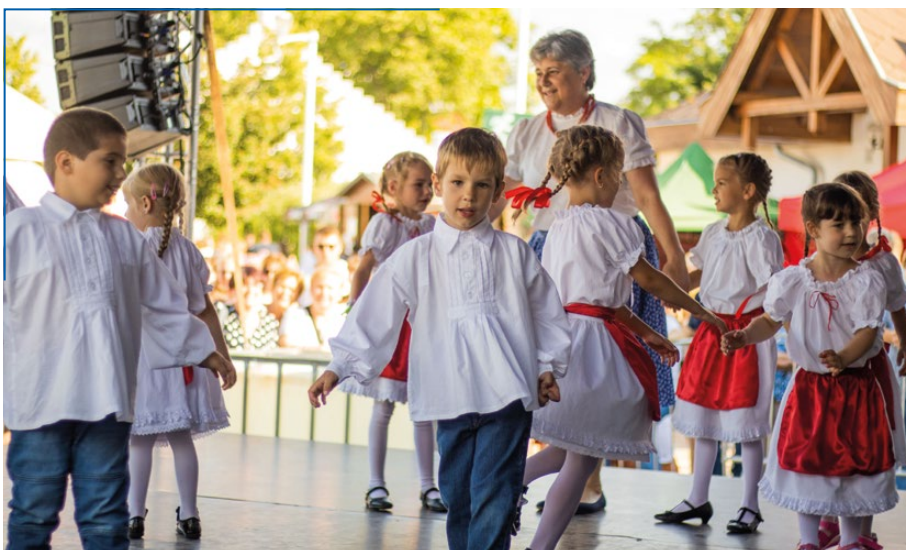
Eszterlánc - ovis néptáncosok

Amit biztosan állíthatok, hogy a hozánk érkező zenészek, táncosok, előadók, művészek mindegyikét maximális szeretet és megbecsülés veszi körbe az ittléte során, hiszen mindegyikük szívesen készít velünk közös képet, mindegyikükkel váltunk pár szót, vagy többet, és az általuk elmondottakból leszűrhető, hogy valóban példaértékű ellátásban, kedvességben van részük Répcelakon.