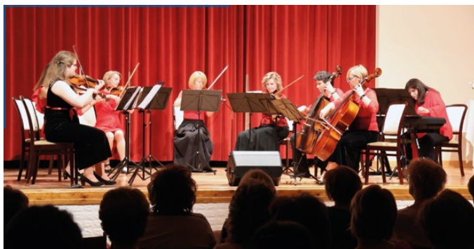
A sárvári vonósok műsora