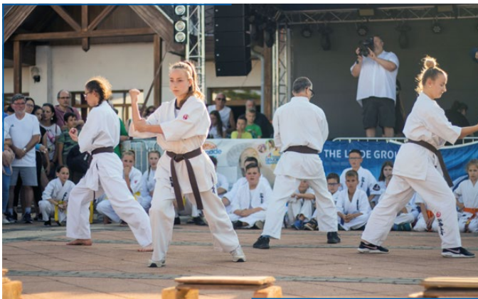
Rakurai Karatésok műsora