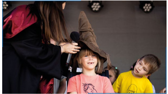
Harry Potter gyerekműsor