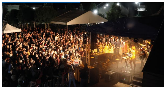
A főtér minden nap megtelt.