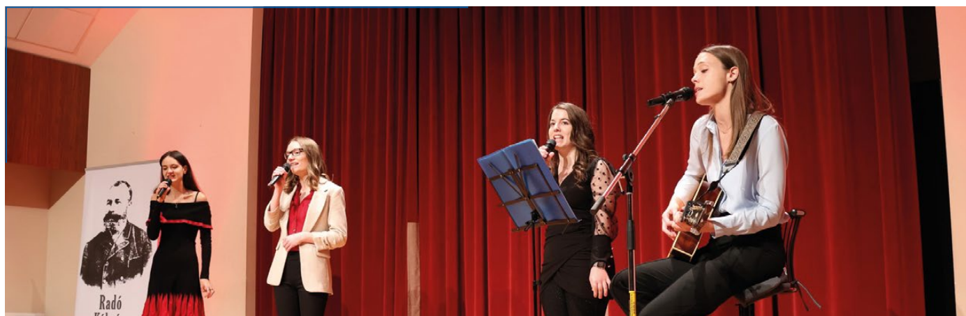
SEK Music Group műsora