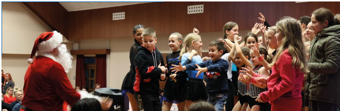
Rock&Roll Utánpótlás Kupa