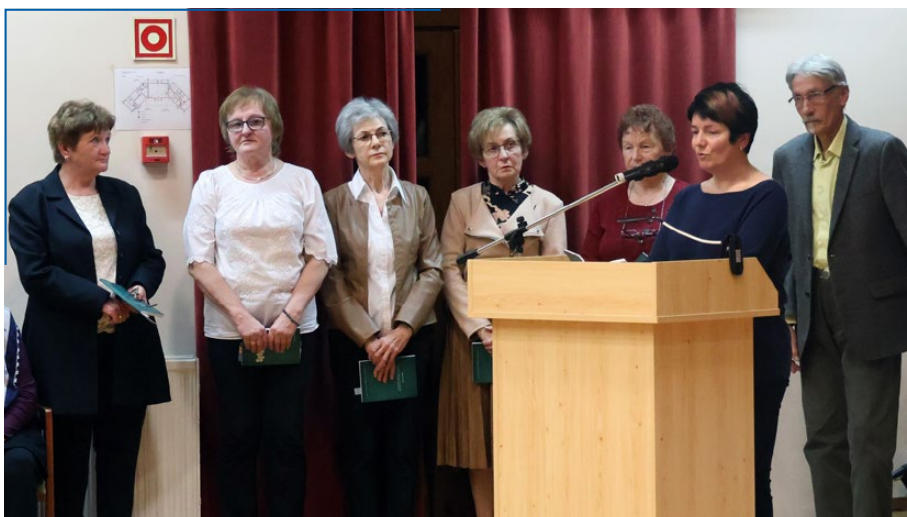
A Szószövők verseskötet bemutatása.