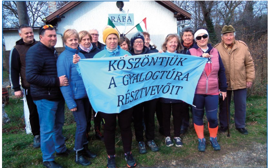
Kirándulók a Rába Természetháznál

Ismét megfigyelhető lesz a Szaturnusz. A rutinosabb látogatók megpillanthatják a legnagyobb holdját, a Títánt, de akár további 2-3 holdat is. A