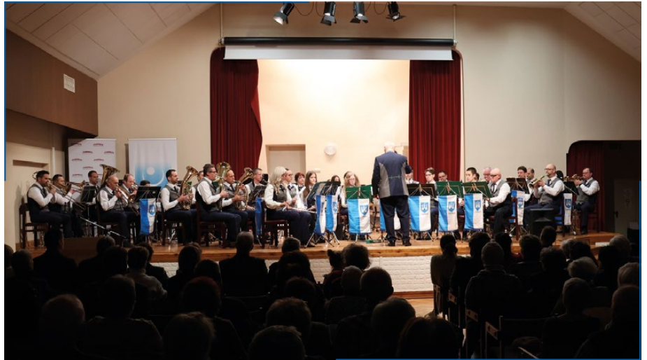
Csepreg Város Fúvószenekara